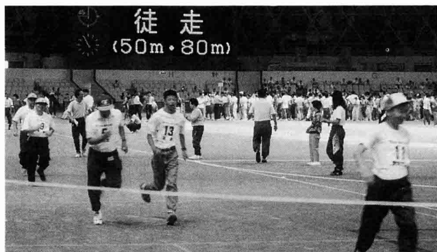
ゴールはもうすぐ！みんながんばれ！

「ぼくらのうんどうかい、がんばるゾ」の言葉どおり、参加した満足感と楽しさに溢れ、盛会の内に幕を下ろしました。