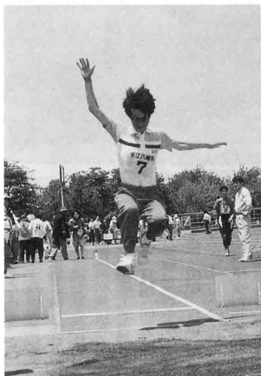
跳んだ! (走幅跳競技より)

地区成績は次の通りです。 優勝 甲賀地区 147点 準優勝 湖東地区 124点 第3位 愛犬地区 103点 第4位 湖北地区 98点 第5位 湖南地区 87点