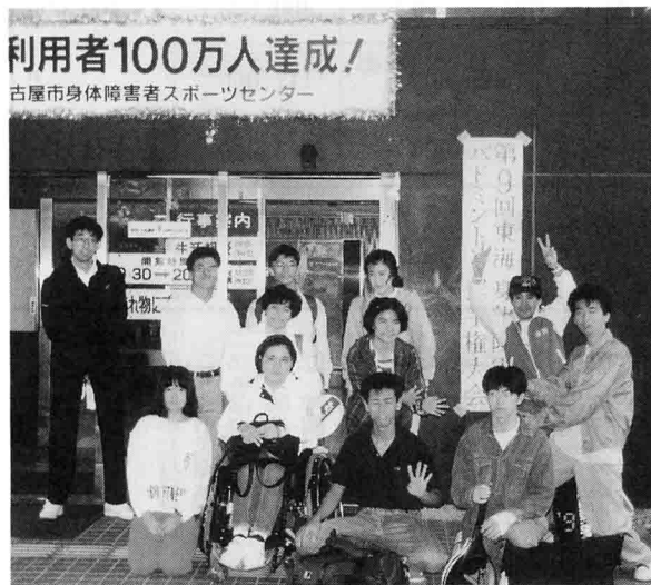
第9回東海身体障害者バドミントン選手権での一コマ

バドミントン好きの人が集まり、障害者も健常者も皆が仲間になり、力を合せて助け合いながら、第二の家族の様にクラブ活動をやって行きたいと思ひます。