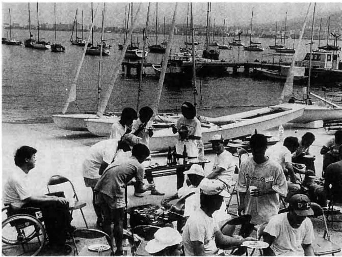
クルージング後、バーベキューで盛り上がる参加者