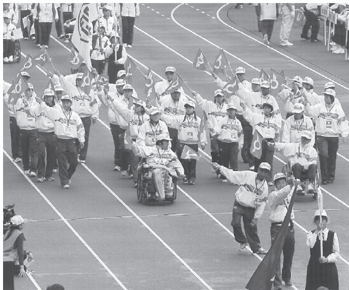
滋賀県選手団の入場行進 (10月10日)

10月10日から12日までの3日間にわたり、「トキはなて君の力を大空へ」のスローガンのもと、第9回全国障害者スポーツ大会(トキめき新潟大会)が東北電力ビッグスワンスタジアムを中心に開催されました。 直前に台風通過があるなど、天候には恵まれたと言えませんが、全国から集まった選手約3,500人の熱気で大会は大いに盛り上がりました。