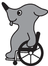
第10回全国障害者スポーツ大会(ゆめ半島千葉大会2010)大会マスコット「チーバくん」