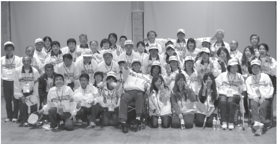
閉会式後の1コマ (10月25日)

平成22年10月23日から25日の3日間にわたり、「ゆめ半島 みんなが主役 花咲く笑顔」のスローガンのもと、第10回全国障害者スポーツ大会(ゆめ半島千葉大会)が開催されました。今大会には滋賀県から個人競技の24名が出場し、金11個、銀9個、銅5個の計25個メダルを獲得しました。