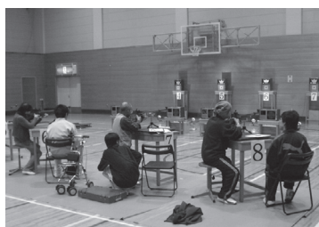
ビームライフル競技大会の1コマ