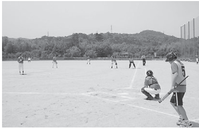
ソフトボール競技の1コマ