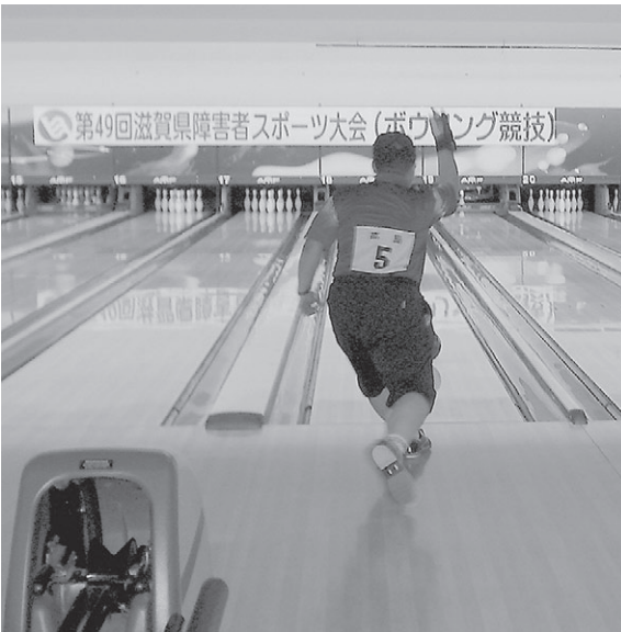
7月24日(日) 県大会 (ボウリング競技)

一般の部では、全国大会希望者をしのぐ、170点ものアベレージを出す選手がある一方記録はともかく、ボウリングを「楽しむ」ことに専念している選手もあり、幅広いレベルの選手たちが、プレイを満喫しておられました。