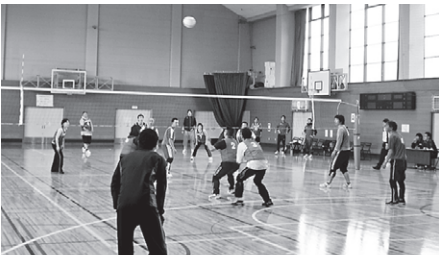
精障バレーボール競技での1コマ

知的障害の団体競技は今年度2回目となり、来年の全国大会近畿予選会の選考会を開催しました。知的・精神とも近畿予選会突破を目指し、チームの枠を超え、新たな合同チームを作りチャレンジします。この時期から来年の6月に開催される近畿予選会に向け選手強化することになりました。今年こそは近畿大会を突破し、第13回全国大会の出場権を獲得していただきたいと思っております。