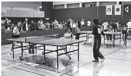
卓球大会での1コマ