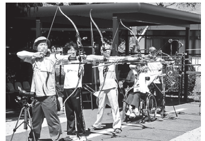
アーチェリー大会での1コマ