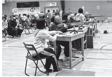
会員交流チームライフル大会での1コマ

団体競技では昨年3位の甲賀市が順位を上げ、優勝の大津市に6点差までせまる勢いを見せた。大会は大いに盛り上がりました。なお、上位を占めた、滋賀県チームライフルクラブは大津・甲賀・高島を中心に活動されています。興味のある方は是非ご参加ください。