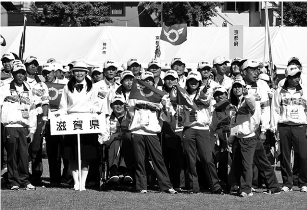
全国大会開会式前の1コマ

組で胸差の接戦を制し、3位入賞を果たしました。 昨年度からの候補・育成選手制度をはじめ、今年度から取り組んだ競技別練習会では、各競技監督・コーチが競技に応じた練習計画を立て運営した結果、大きな成果を上げることができました。また、岐阜県本部の方々、学生ボランティアの皆さんには、滋賀県選手団のためにご尽力いただき、ありがとうございます。選手を支えて下さった全ての関係者に感謝いたします。 次回、第13回全国障害者スポーツ大会(スポーツ祭東京2013)は、平成25年10月12日から14日までの3日間、東京都で開催されます。