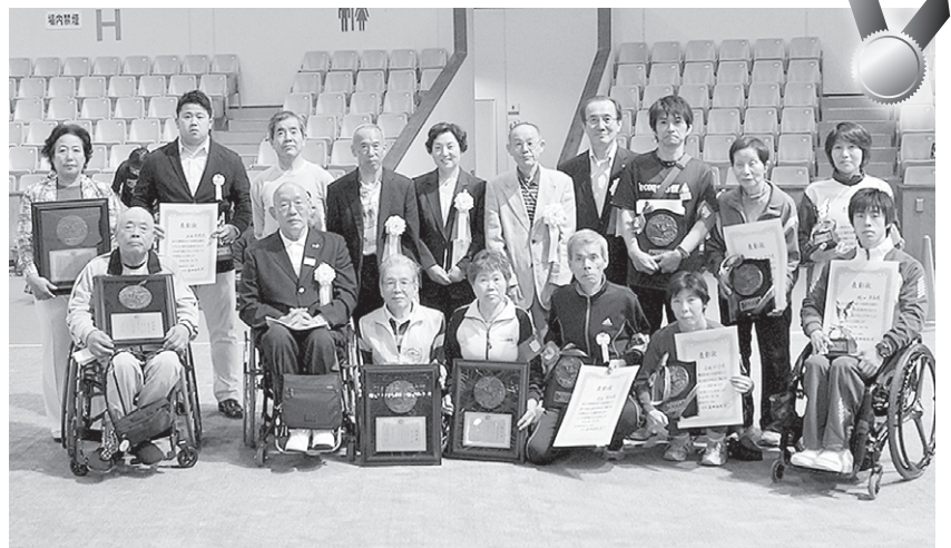
5月18日 表彰後の1コマ