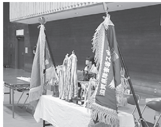
果たして来年の入賞は...