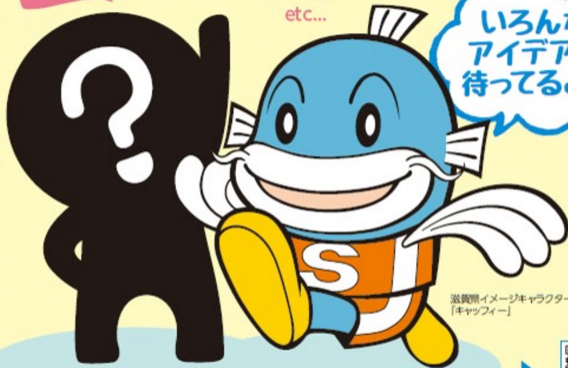
滋賀県イメージキャラクター 「キャッフィー」