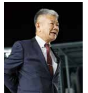
目片信悟滋賀県議会議長